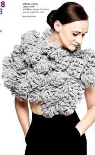
GRASSI MUSEUM LEIPZIG IN DER MESSHALLUNG 11 JOHANNISPLATZ 5-11 www.grassimesse.de